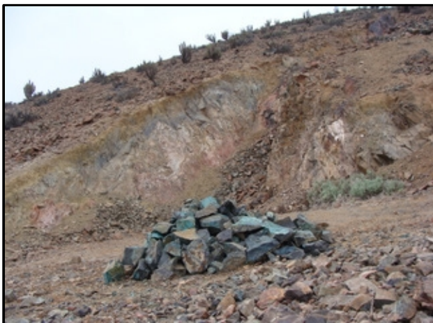
Veta principal con desmonte