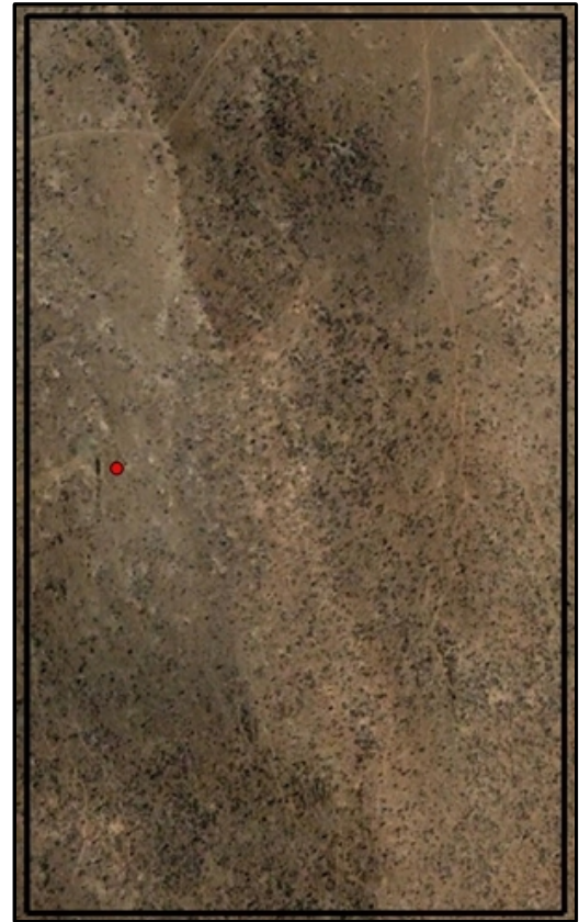
Imagen salelital de la pertenencia